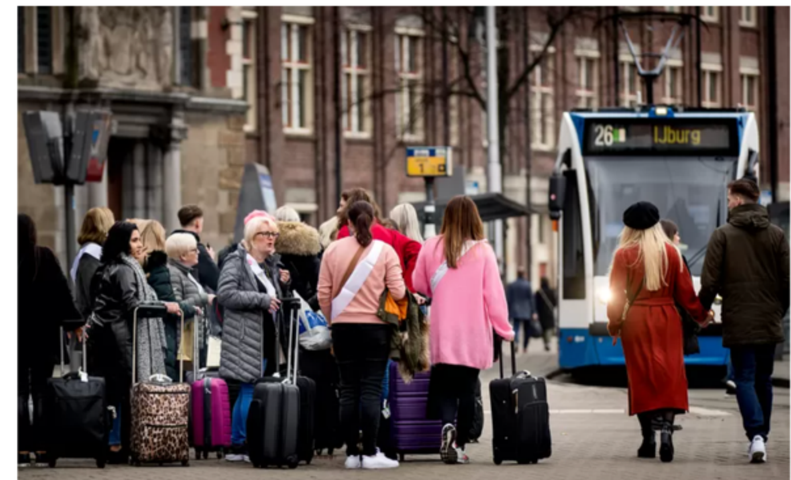
Toeristen in het centrum van Amsterdam.